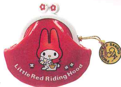
ビニールパース 1975年