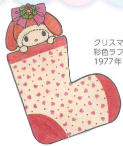
クリスマスカード用 彩色ラフ画 1977年