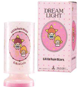
ドリームライト 1976年