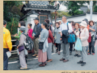
ボランティアガイド