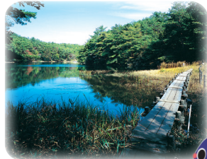
湿原保護協力費/200円

昭和55年に国の天然記念物 に指定され、「西の尾瀬」とも 形容されます。 200種を超える貴重な湿原 の植物が自生し、5月頃から 11月初旬まで自然を楽しむこ とができます。周囲は2.4km あります。